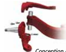
Conception du porte fusé en deux pièces